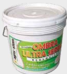
CONFEZIONI Secchiello da 14 lt